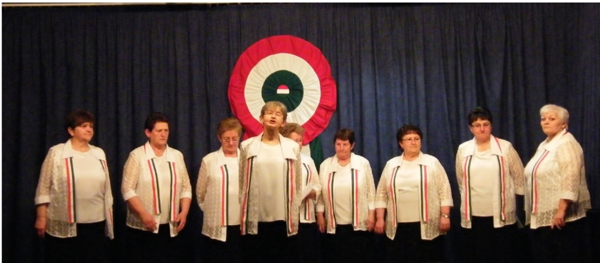
A Szivárvány Nyugdijas Klub fellépett a település Március 15-i rendezvényén.