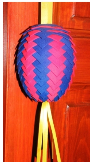
Erdei Istvánné alkotása